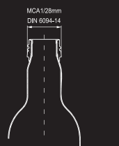
Schulter Shoulder Epaule

Die Drinks Bottle, entwickelt als hochwertige Verpackung für Getränke*, ist das jüngste und innovative Kind der Nussbaum Gruppe. Mit ihrem Lifestyle-Charakter trifft sie den Trend der Zeit und ist vor allem auch eine praktische, überzeugende Alternative zu Glas und Kunststoff – immer mit dem Touch des Besonderen.